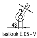
lastkrok E 05 - V